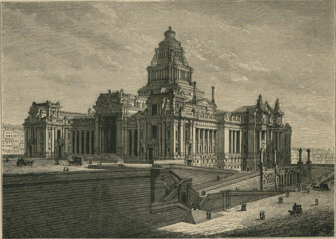
VUE D'ENSEMBLE DU PALAIS DE JUSTICE.

L'œuvre se continue de jour en jour. La vieille ville se dépouille peu à peu de son accoutrement antique. La ville nouvelle gagne du terrain sans cesse, s'arrondit,